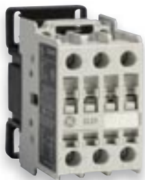
Contactor Series CL Referencia: CL25A300T-M